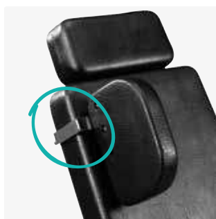
Soportes laterales, interiores 88075-x