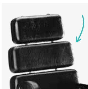
Cojín extra tercera plataforma 88106-x