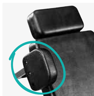
Soportes laterales, exteriores 88065-x