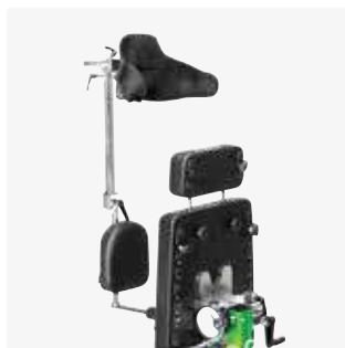
Reposacabezas (prono) 88124-xx