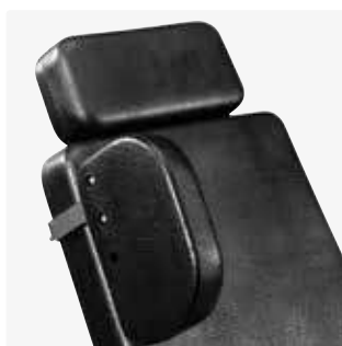
Soportes laterales rectos 88055-x