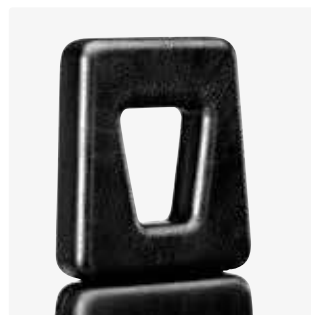
Reposacabezas con apertura facial 88117-x