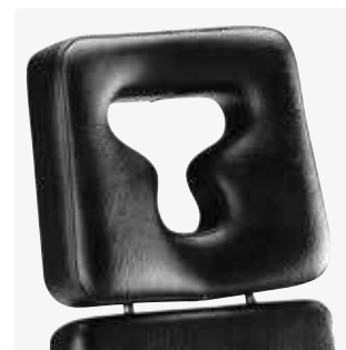
Reposacabezas anatómico con apertura facial 88119-x