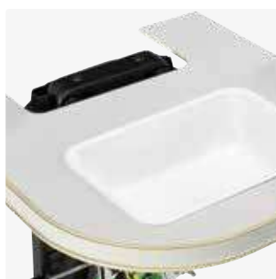
Mesa de madera 88113-x Almohadillado para mesa 862135-x