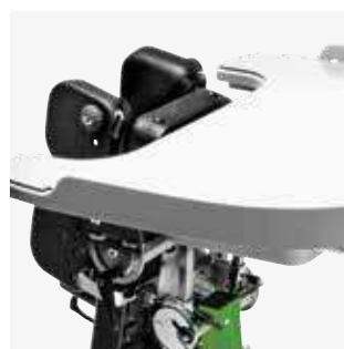
Mesa de plástico con cubeta y tapa 88108-x