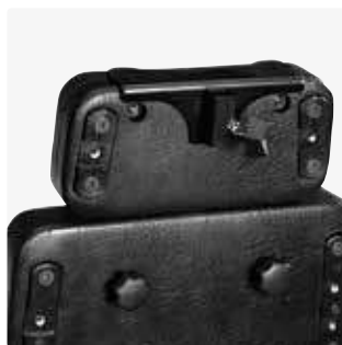
Adaptador para reposacabezas (supino) 88130