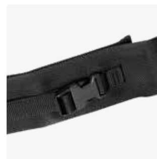
Cinchas para soportes laterales 88250-x